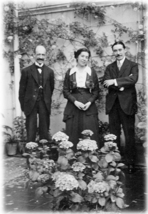
Manuel de Falla, María Lejárraga y Joaquín Turina Madrid 1916